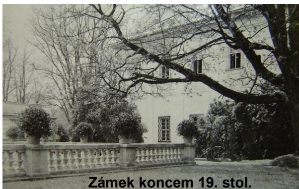
Zámek koncem 19. stol.

Kroniky obce Pohled byly mnohokrát oceněny při soutěžích kronikářů, přesto v nich existují „bílá místa“, která si žádají doplnění. Proto bychom tímto chtěli požádat Vás, občany obce, o spolupráci při doplnění chybějících materiálů. Jedná se o období nedávné – roky 1991 – 1999, kdy máme žalostně málo fotografií z dění v obci. Jestliže máte ve svých archívech takovéto snímky (sport, výstavba v obci, činnost spolků, pouť, brigády, povodně, demolice, fungování ZŠ, atd.), dovoďte nám využít je jako materiál potřebný k doplnění kronik.